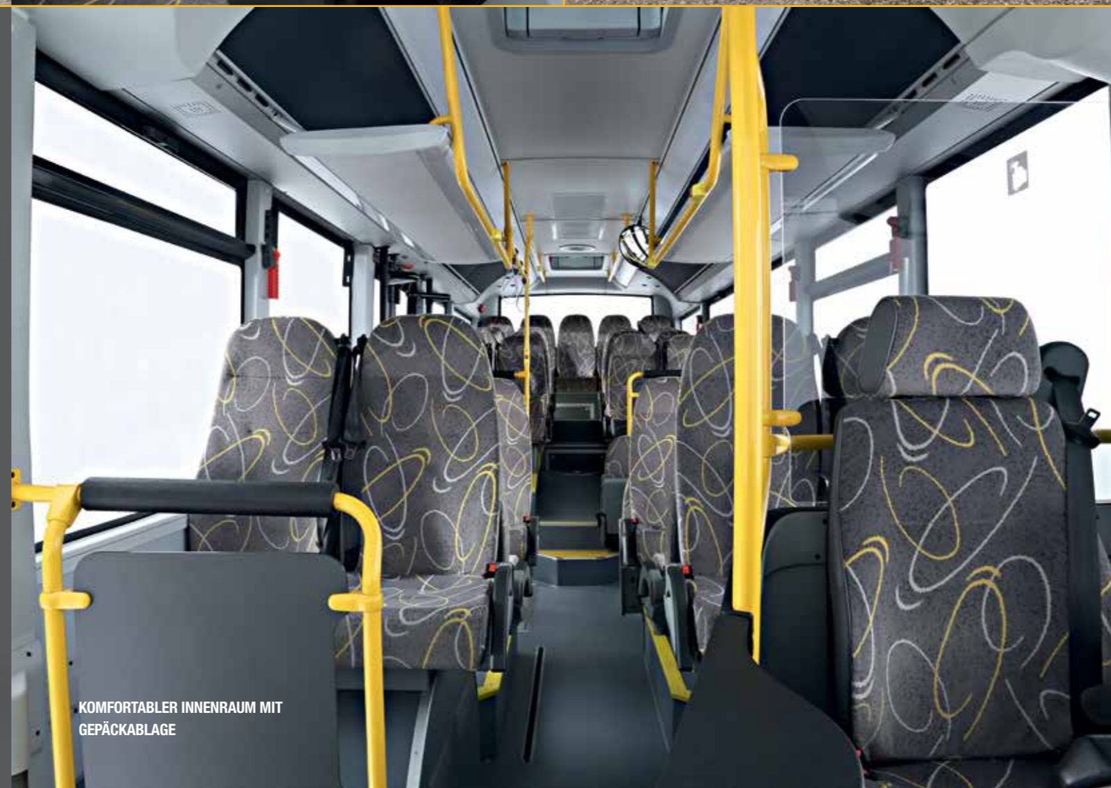
KOMFORTABLER INNENRAUM MIT GEPÄCKABLAGE