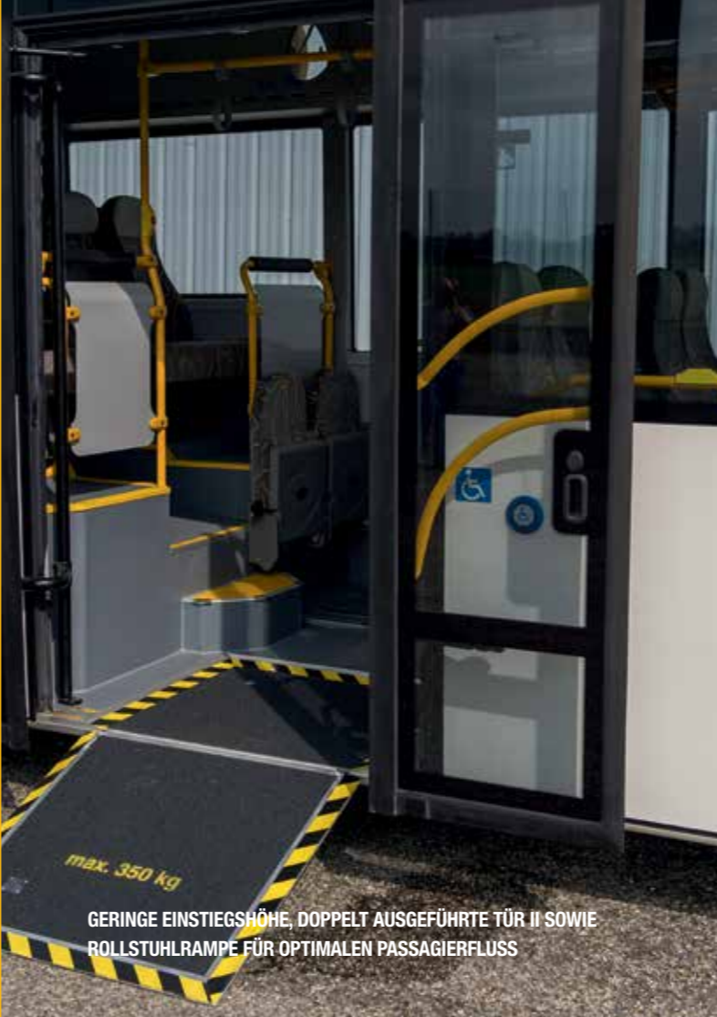
GERINGE EINSTIEGSHÖHE, DOPPELT AUSGEFÜHRTE TÜR II SOWIE ROLLSTUHLRAMPE FÜR OPTIMALEN PASSAGIERFLUSS