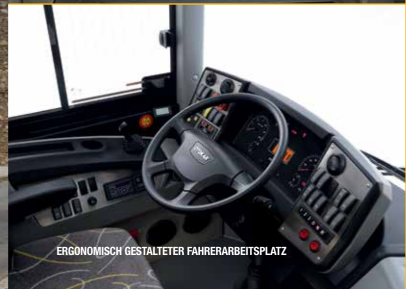
ERGONOMISCH GESTALTETER FAHRERARBEITSPLATZ