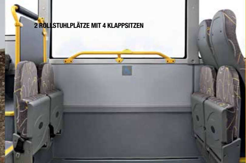
2 ROLLSTUHLPLÄTZE MIT 4 KLAPPSITZEN